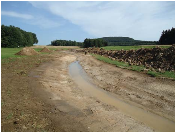
Bauphase August 2013