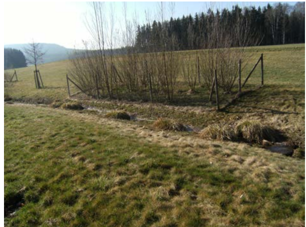
Gewässerabschnitt nach Renaturierung im April 2018