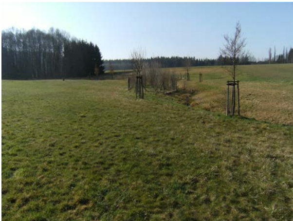
Gewässerabschnitt nach Renaturierung im April 2018