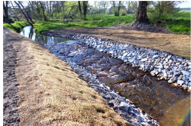
Gewässerabschnitt direkt nach Realisierung