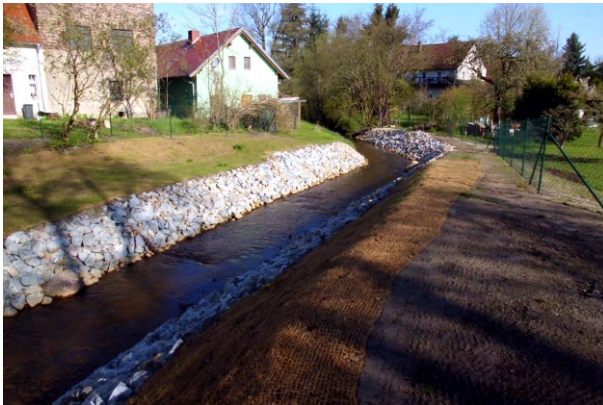
Gewässerabschnitt direkt nach Realisierung