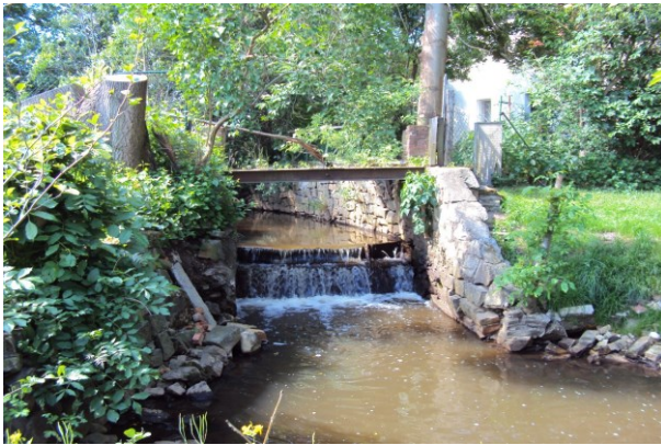
Mühlwehr vor Umsetzung der Maßnahme