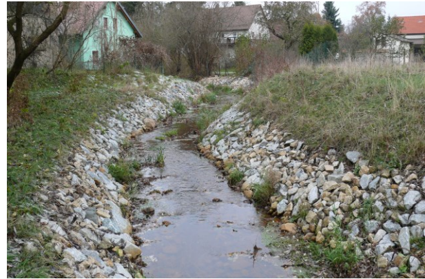
Gewässerabschnitt nach erster Vegetationsperiode