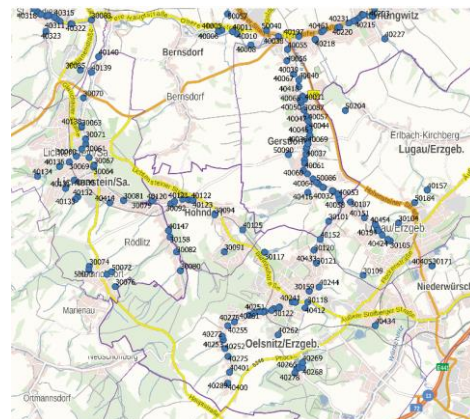
Abbildung 1: Lage von Einleitstellen niederschlagsbedingter Abflüsse (MWE, NWE) am empfangenden Gewässer (Beispieldarstellung)

Es sollen NW-Abflüsse/ -Einleitungen aus Siedlungen, von gewerblich genutzten Flächen und Straßen erfasst werden.