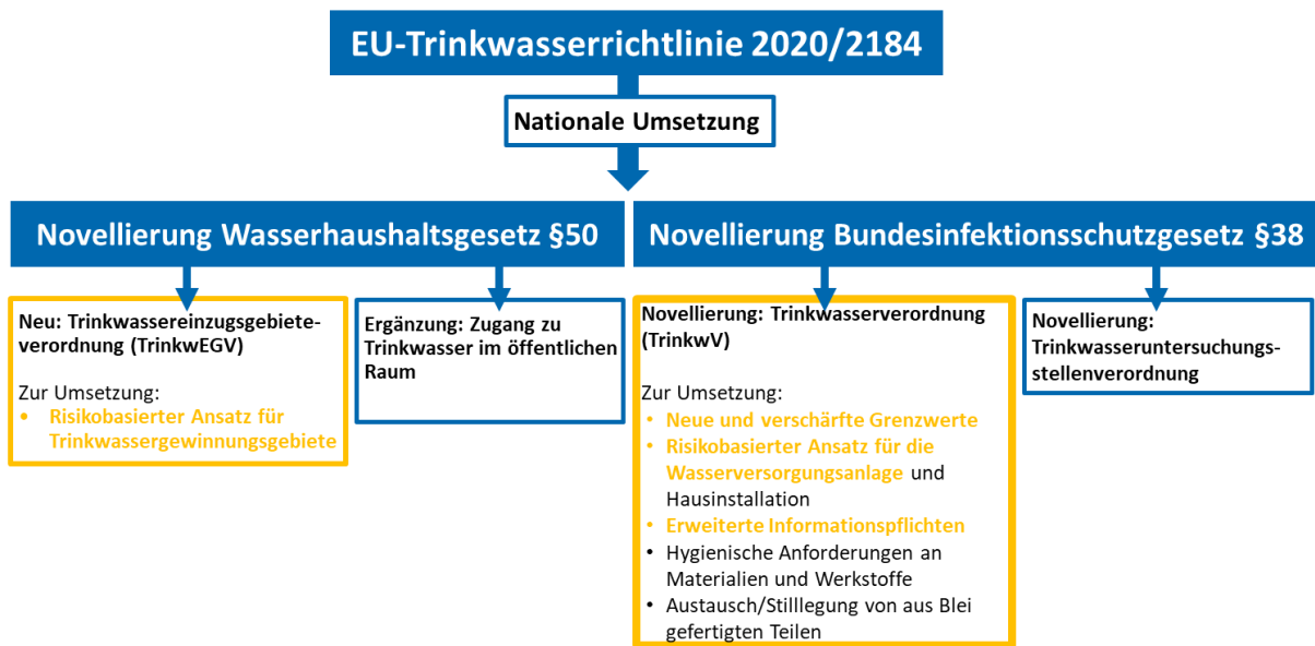
Abb. 1: Umsetzung der Trinkwasser-Richtlinie in deutsches Recht

Zur Umsetzung der EG-Trinkwasserrichtlinie vom 20.12.2020 ist die Zweite Verordnung zur Novellierung der Trinkwasserverordnung vom 20.06.2023 am 24.06.2023 in Kraft getreten ( https://www.recht.bund.de/bgbl/1/2023/159/VO.html ). Zur Umsetzung der Trinkwasser-Richtlinie in deutsches Recht waren zahlreiche Novellierungen erforderlich: