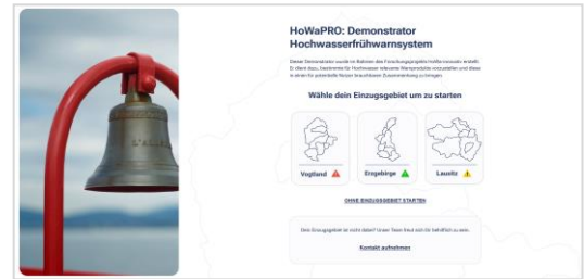
Startseite mit vorhandenen Testregionen und Warnhinweis bei Hochwasserpotential