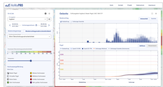
Detaillierte Darstellung des prognostizierten Abflusses mit Unsicherheitsbereich